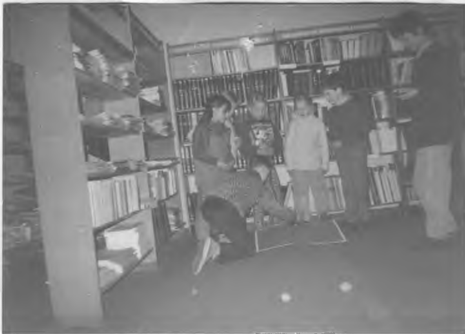
Popiete "Velykos, Velykos: duok kiaušinių!"