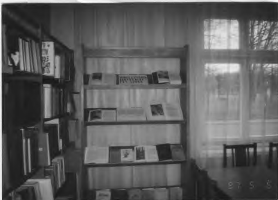
Literatūrinė paroda "Jonas Avyžius Tautos ir Žemės Sūnus"