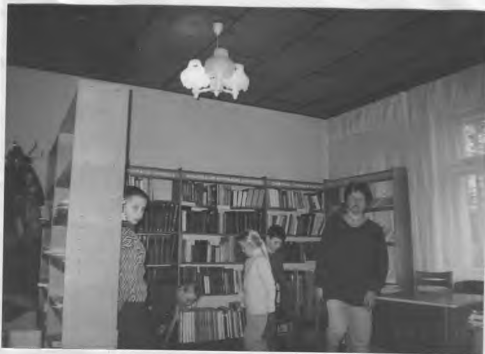
Popietė * Velykos, Velykos: Duok kiaušinių